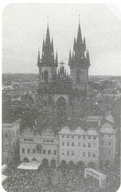
Staroměstské náměstí cíl všech závodů