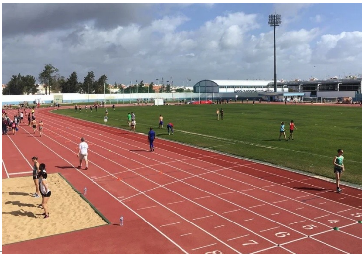
Oficiální partneři Českého atletického svazu